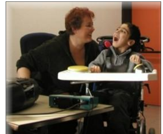
Umfeldsteuerung mit BIGmack zur Ansteuerung eines CD-Players