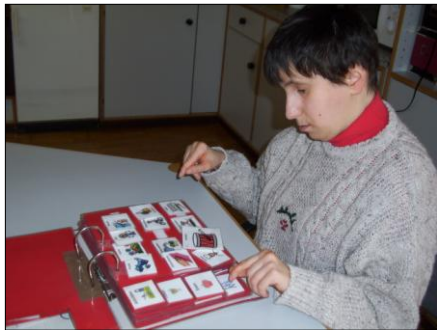
Kommunikationsmappe um Entscheidungen zu Treffen